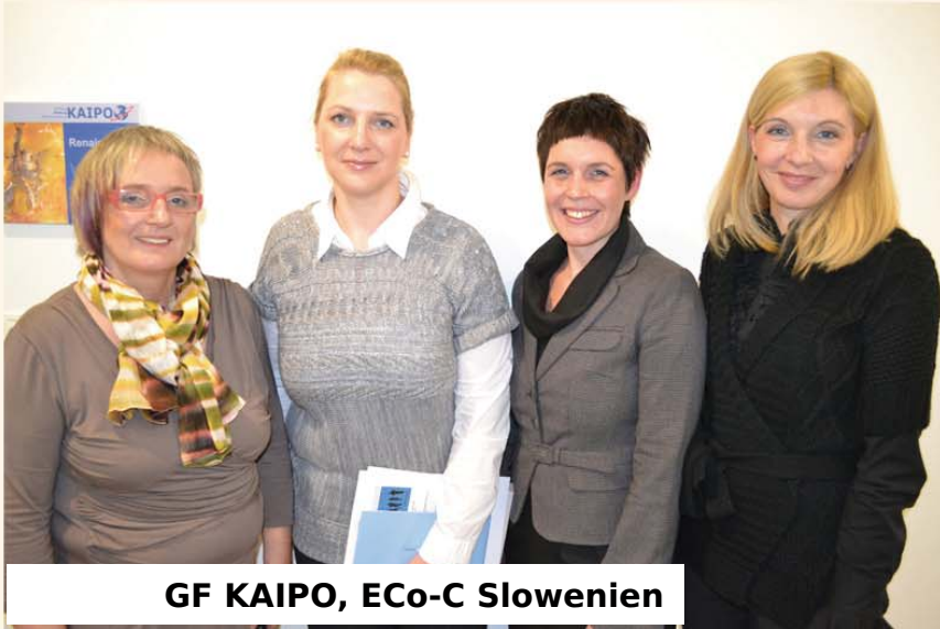
GF KAIPPO, ECo-C Slowenien

ECO-C European communication certification www.eco-c.eu